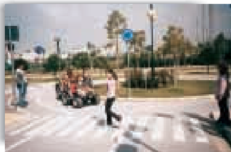
Επίσκεψη στο πάρκο Κυκλοφοριακής Αγωγής